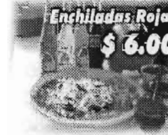
Enchiladas Rojas $6.00