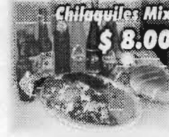
Chilaquiles Mix $8.00