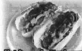
Hot Dog a la Mexicana