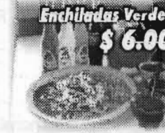
Enchiladas Verdes $6.00