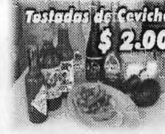
Tostadas de Ceviche $2.00