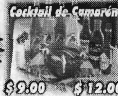
Cocktail de Camarón