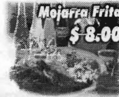
Mojarra Frita $8.00