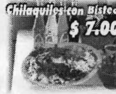
Chilaquiles con Bistec $7.00