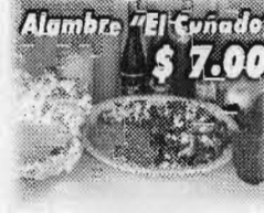
Alambre "El Guñado" $7.00