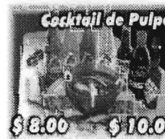
Cocktail de Pulpo