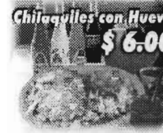
Chilaquiles con Huevo $6.00