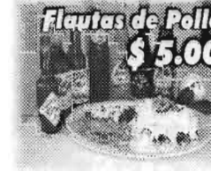
Flautas de Pollo $5.00