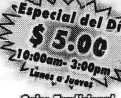
Especial del Día $5.00