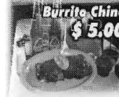
Burrito Chino $5.00