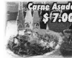
Carne Asada $7.00

Los Sábados y Domingos Todos los Especiales son Servidos con Tortillas Hechas a Mano.