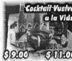
Cocktail Vuelve a la Vida