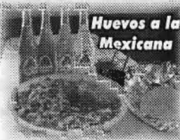
Huevos a la Mexicana